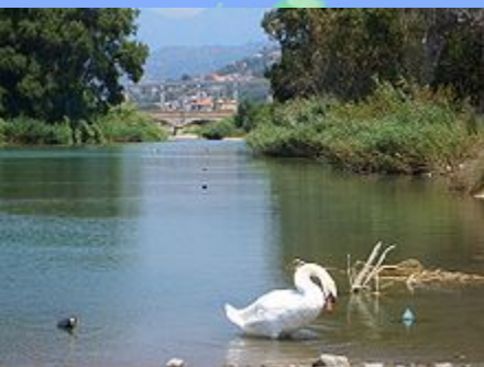
LA NOSTRA ISOLA ECOLOGICA