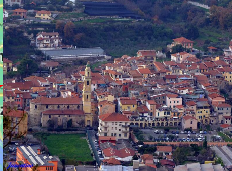
IL NOSTRO PAESE CAMPOROSSO