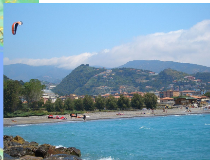
IL NOSTRO MARE