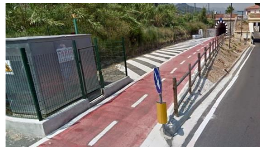
LA NOSTRA CICLABILE